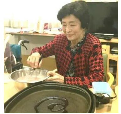
桜餅を作りました。