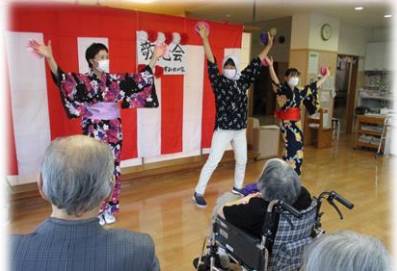
職員が盛り上げますよ～