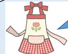
エプロン等のご用意ありがとうございました。