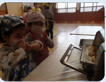
いいにおいがしてきたあ