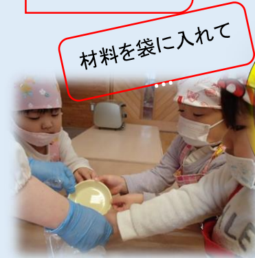
材料を袋に入れて