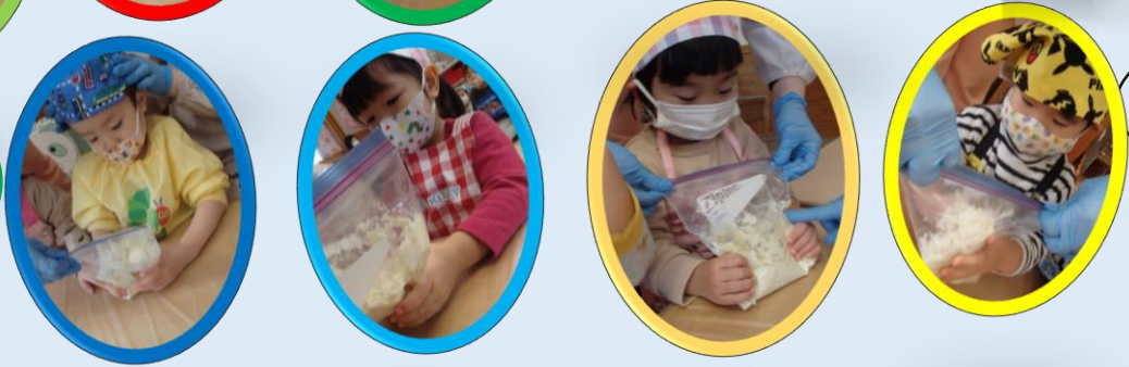
やわらかくてきもちいい♡