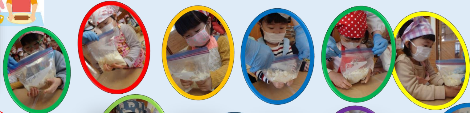
はやくもみもみしたいな...