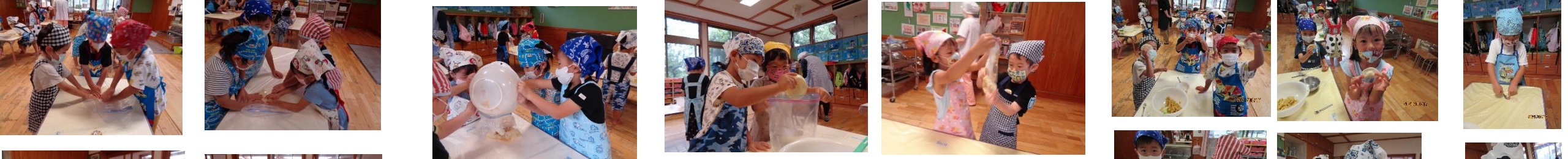
②その他の材料を入れて混ぜます。