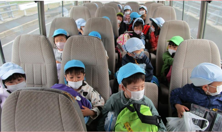
バスに乗ってレッツゴー！