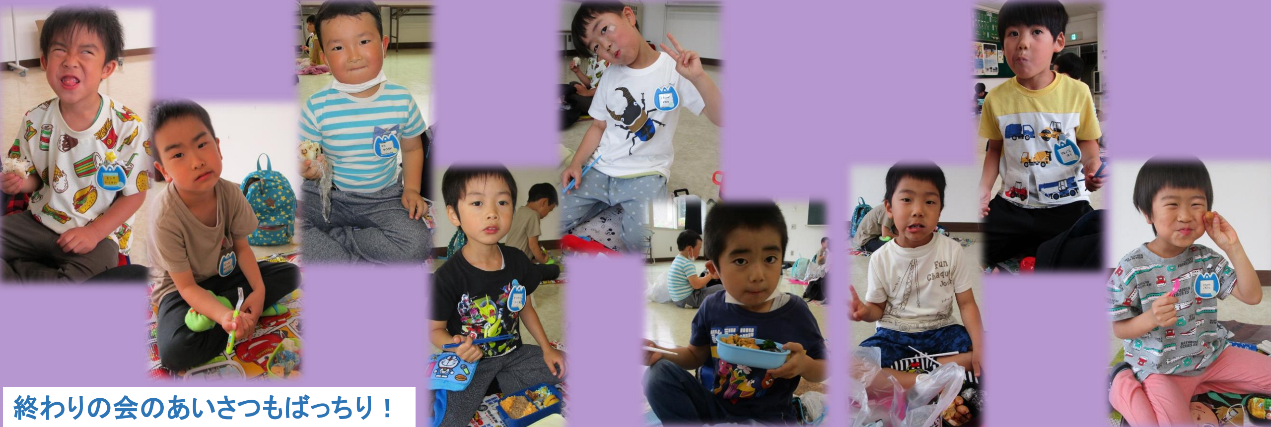
終わりの会のあいさつもばっちり！