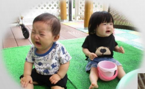
泣きつつも、気になる。。