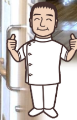
プライバシーに配慮した多床室