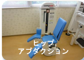
ヒップ アブダクション