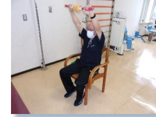
棒体操で上肢の筋力強化