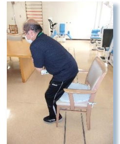
立ち上がりの反復練習