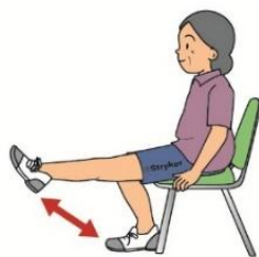
膝を左右交互に伸ばす