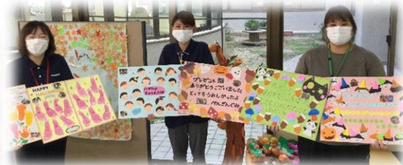
園児さんからお礼の品を頂きました