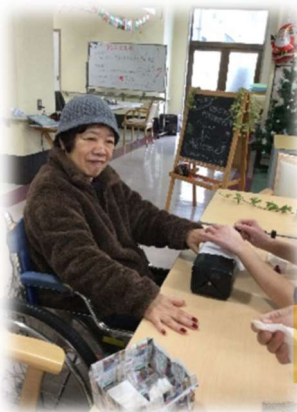
マニキュアを塗っておしゃれ♪