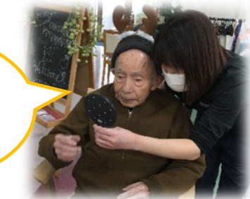
眉毛カットして鏡でチェック!!