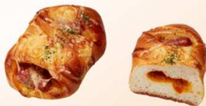
カレーポテトウインナーパン 150円