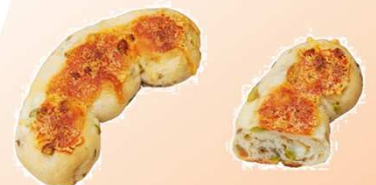
枝豆チーズパン 150円