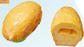
レモンケーキパン 170円