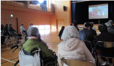
激辛ラーメンに「辛い！辛いです！」 大盛り上りの二人羽織 →